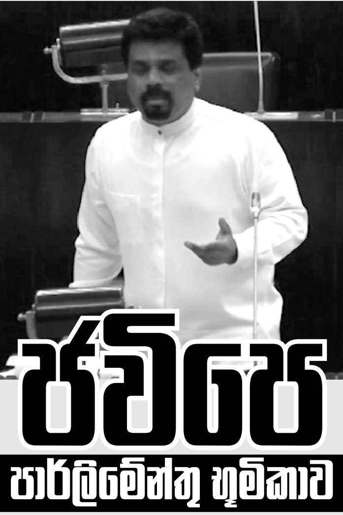
ලැබේ. මෙමගින් නැවත ඔප්පු වී තිබෙන්නේ ජවිපෙ ප්‍රතිසංස්කරණවාදී දේශපාලනයට යොමු වෙමින් නව ධනපති පක්ෂයක් ගොඩ නැගුණේ දිසාවට ගමන් කරමින් තිබෙන බව ය. ■

අනුර කුමාරගේ මේ ආර්ථික දැක්ම 70 දශකයේ සමගි පෙරමුණ ආණ්ඩුව ක්‍රියාවට නැගුවක් බව මෙයින් පැහැදිලි වේ. මේ ආර්ථික සැලැස්ම මගින් ජවිපෙ දේශපාලන දැක්ම හොඳින් පැහැදිලි වේ. මෙවැනි ආර්ථික වැඩපිළිවෙලක් වර්තමානයේ කුමන රටකවත් ක්‍රියාවට නගන්නේ නැත. එය ධනපති ක්‍රමය ප්‍රතිසංස්කරණය කිරීමේ මාවතක් බව දකින්නට